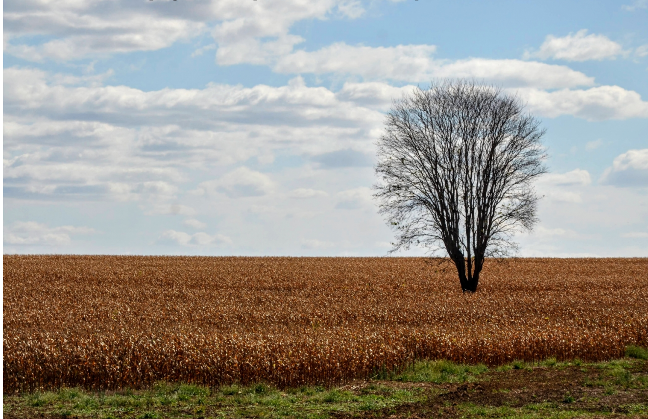
Livro também traz indicação de sites, filmes e documentários, textos reflexivos e estudo de caso