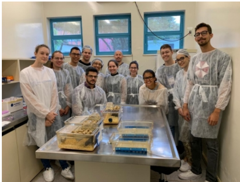
Rede de Biotérios de Roedores da UFU (REBIR). Na foto, curso prático de uso ético de animais em pesquisa, ministrado antes da pandemia de covid-19