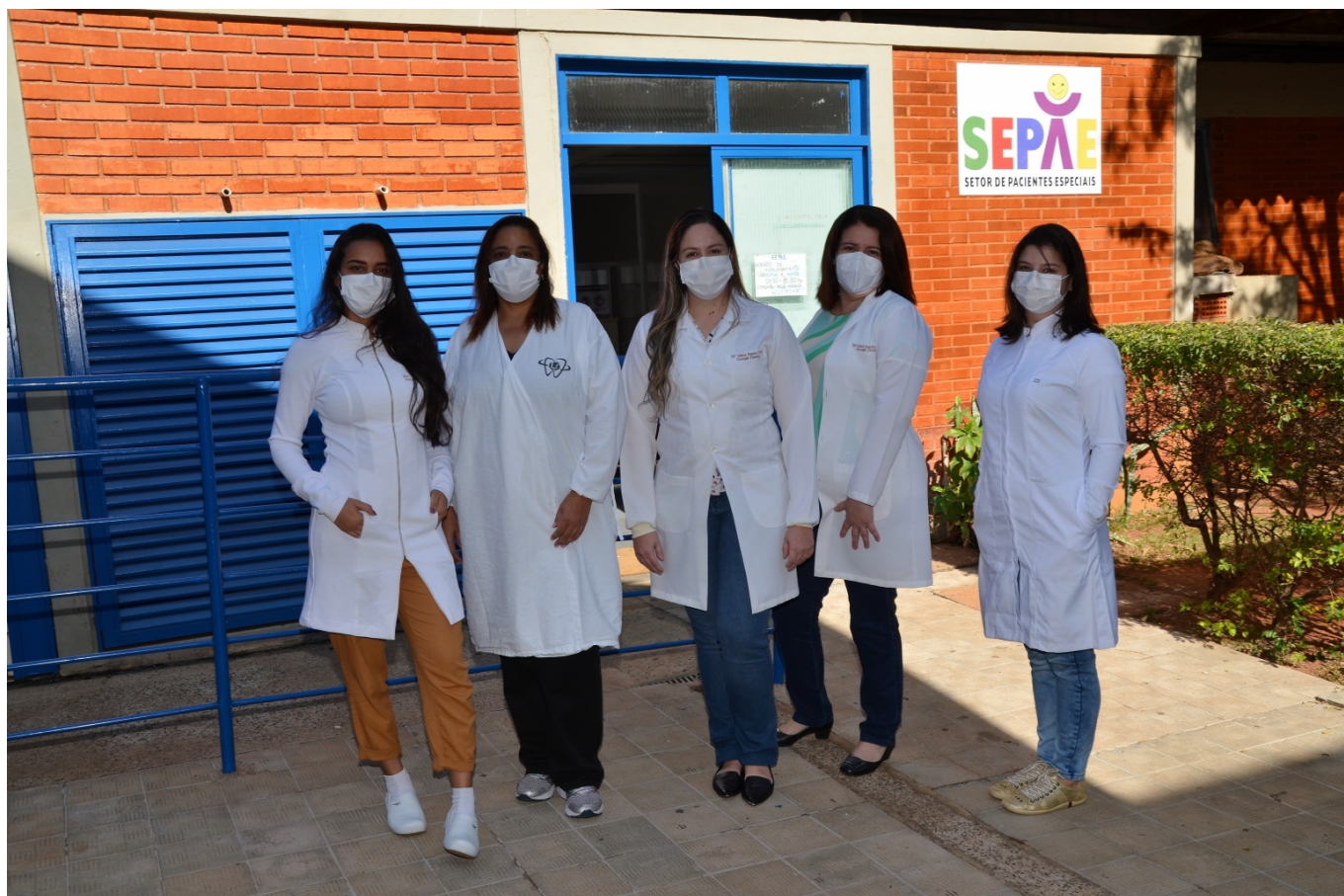
Profissionais do Sepae possuem especialização no atendimento de pacientes especiais; setor fica no Campus Umuarama, junto ao Hospital Odontológico.