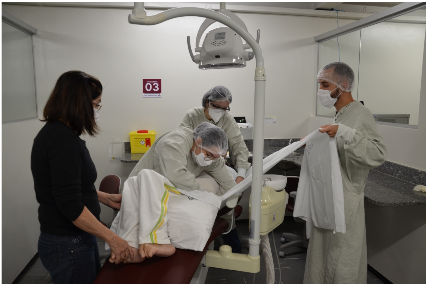
Especialistas do Sepae atendem pacientes com necessidades especiais, devidamente acompanhados por seus responsáveis