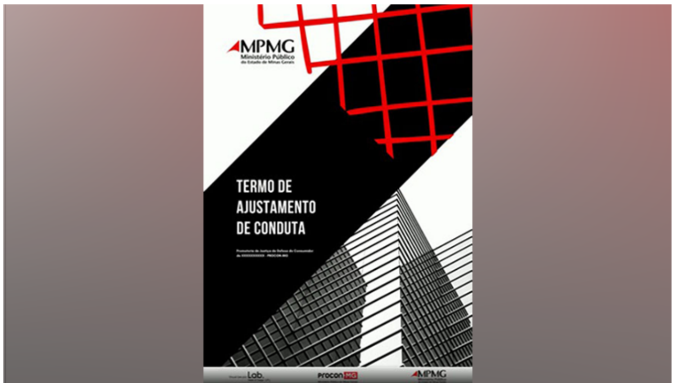
Projeto piloto do Termo de Ajustamento de Conduta (TAC) desenvolvido pelo Laboratório de Direito e Design UFU

Em projeto piloto, o Procon disponibilizou, no último dia 13, o Termo de Ajustamento de Conduta (TAC) desenvolvido em conjunto com o Laboratório de Direito e Design da Faculdade de Direito da Universidade Federal de Uberlândia (Fadir/UFU). Os principais objetivos da proposta são tornar a comunicação jurídica mais acessível para os cidadãos e aumentar a participação da sociedade na fiscalização das obrigações pactuadas em Termos de Ajustamento de Conduta (TACs) firmados pelo Ministério Público de Minas Gerais na área do consumidor.