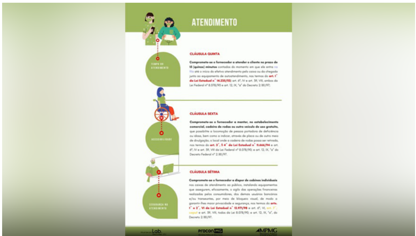
Página do projeto piloto do Termo de Ajustamento de Conduta (TAC) desenvolvido pelo Laboratório de Direito e Design UFU

Para os pesquisadores, a implementação de práticas de Visual Law e Legal Design na esfera pública é algo essencial, uma vez que lá se encontra a assistência dos vulneráveis, em regra, na sociedade. Além disso, visa a fomentar novas práticas no sistema jurídico, facilitando a compreensão das ações promovidas pela Justiça e pelo cidadão. O Ministério Público, na forma do Procon-MPMG, um órgão fiscalizador onde há documentos cujo público-alvo está diretamente ligado ao cidadão, faz com que esta parceria possibilite que o Laboratório de Direito e Design realize o diagnóstico, testagem e implementação de práticas como o Legal Design e Visual Law , a fim de que o Direito seja entendido como ferramenta de acolhimento e solução de conflitos, sem medos.