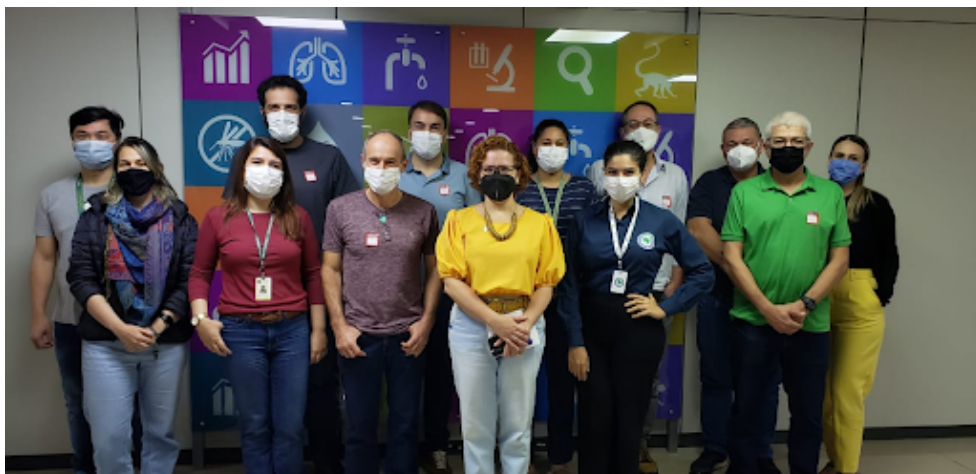
Participantes da oficina para classificação de áreas de risco para vigilância da febre maculosa.