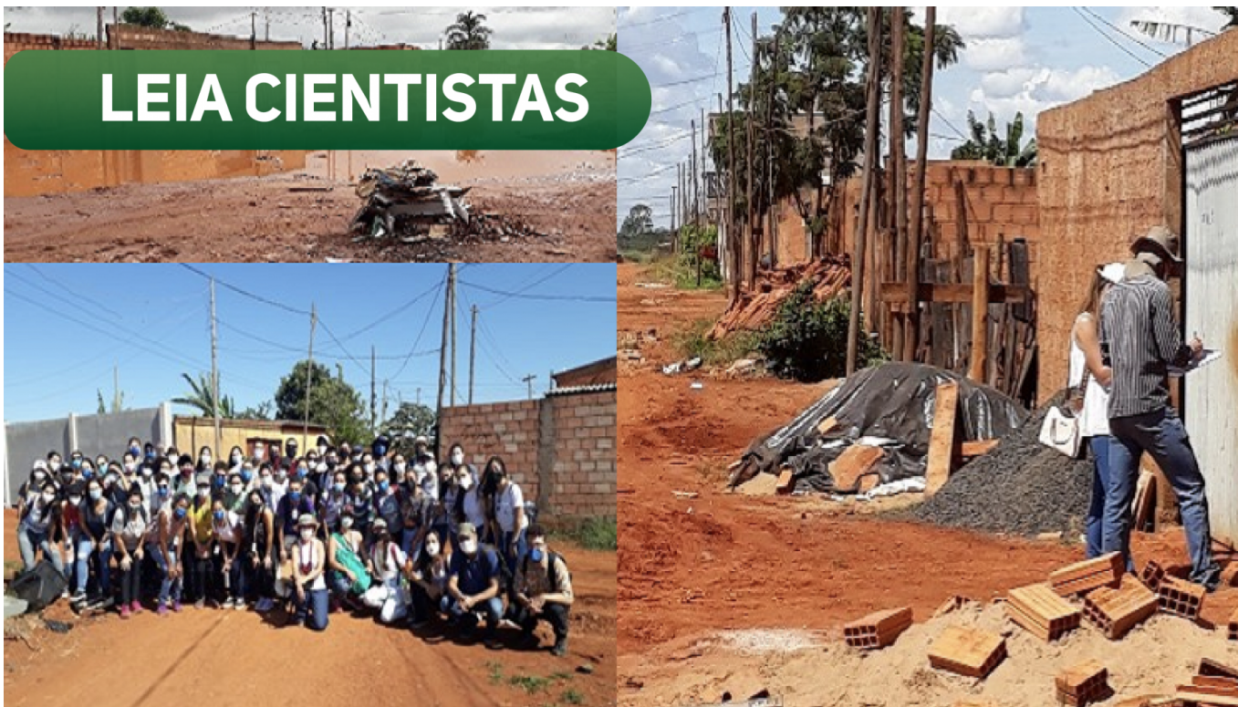
96ª Turma do curso de graduação em medicina realizando atividade prática de territorialização no Assentamento Santa Clara, em Uberlândia.

A formação de profissionais sensíveis à realidade da população ainda é um desafio para a educação médica. Por isso, conhecer o local em que as pessoas vivem e os desafios que encontram para garantir alguma renda, cuidar uns dos outros e acessar serviços básicos — como unidades de saúde e creches —, deve ser parte do processo de ensino dos futuros médicos.