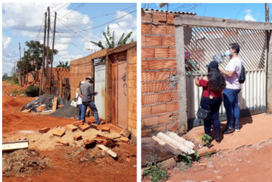
Figura 2: Estudantes de medicina realizando as entrevistas com os moradores do Assentamento Santa Clara.

35% das famílias residentes no assentamento responderam às perguntas do cadastro. Encontramos uma população predominantemente preta e parda e, apesar de muitos terem ensino médio, o ensino superior parece não compor o horizonte de perspectiva do grupo, há muita gente desempregada e