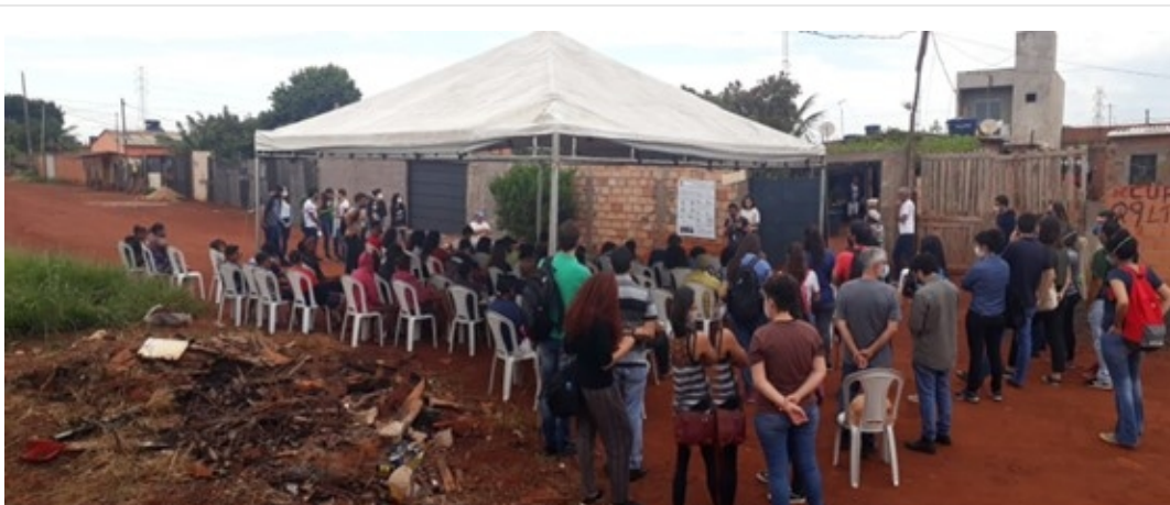
Figura 3: Estudantes de medicina apresentando as informações coletadas durante a territorialização para comunidade do Assentamento Santa Clara.

Apesar do calor penoso nos dias da atividade, os estudantes concluíram com êxito a atividade e no final dos trabalhos deram uma devolutiva preliminar para comunidade (Figura 3), apresentando as informações que foram coletadas e discutindo perspectivas de melhorias das condições de saúde e cuidado da população deste território.