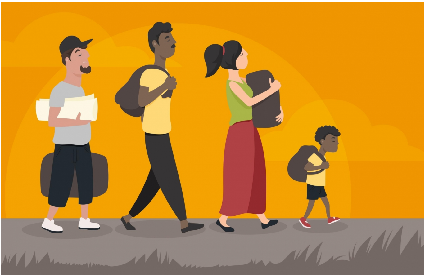
O trabalho reúne pesquisadores de cidades do Brasil, Estados Unidos e Argentina

Uma pesquisa que está em desenvolvimento busca investigar como a pandemia causada por coronavírus impactou a vida de migrantes no acesso à saúde e proteção social.