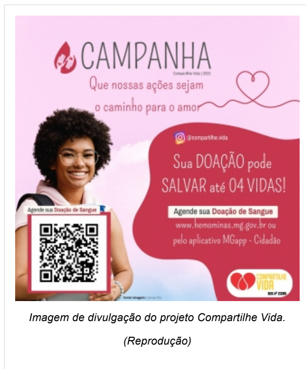
Imagem de divulgação do projeto Compartilhe Vida.