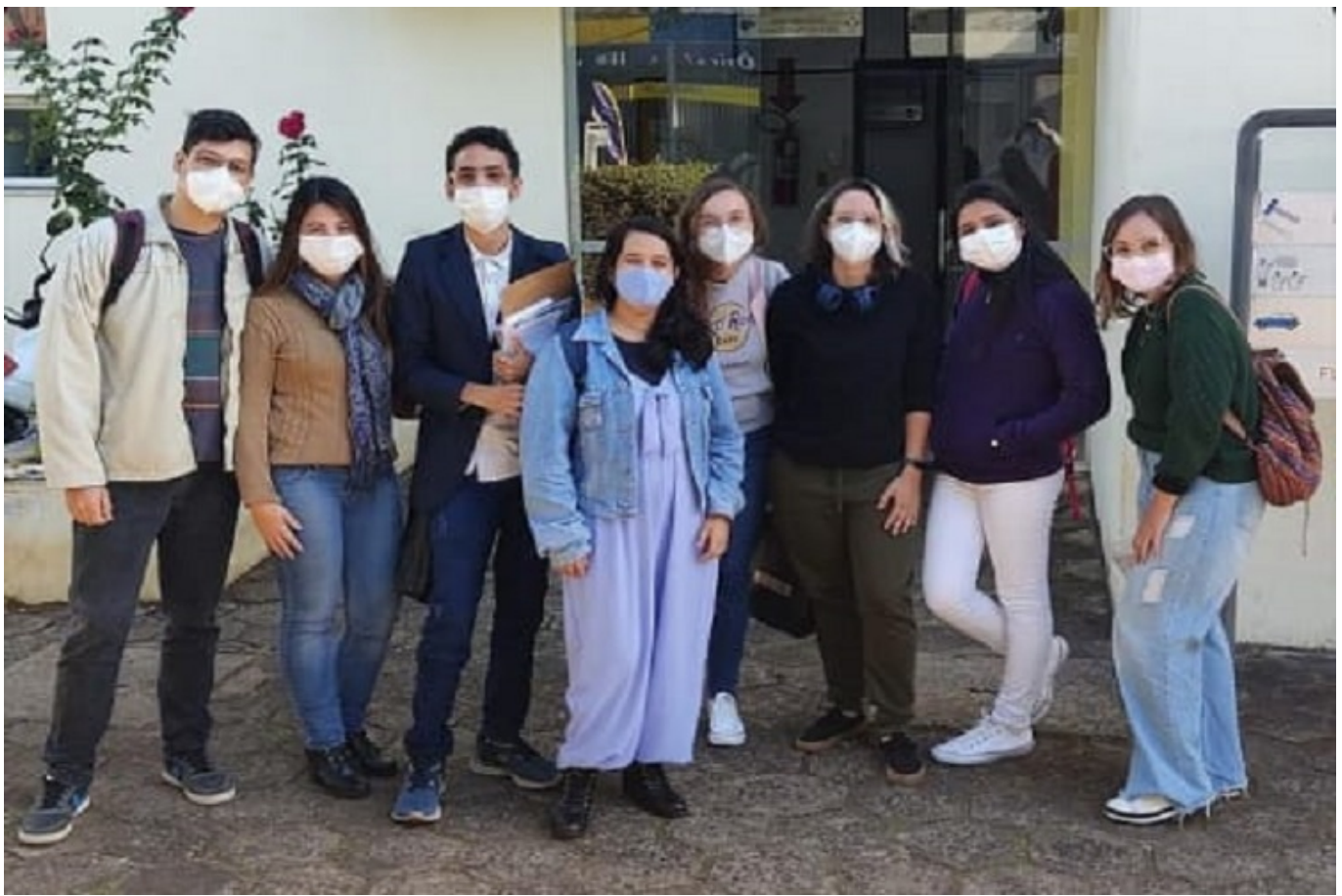
Alunos também estão envolvidos nos dois projetos de extensão.