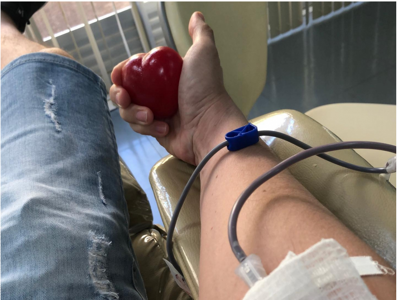
A recuperação de quem doa sangue é rápida e o ato não representa risco para o doador.