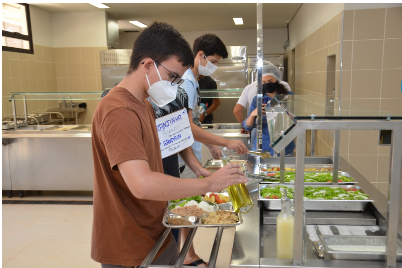
Aluno servindo refeição em restaurante universitário da UFU.

Assim como na última edição do ranking, a UFU mantém, em nível nacional, a sua colocação no 2º lugar no ODS 2, de combate à fome, tendo conseguido aumentar a sua pontuação de 66.8 para 75.9. No âmbito internacional, a UFU foi a 42ª colocada em relação ao Combate à Fome, ou seja, está entre as 50 melhores do mundo no ODS 2.