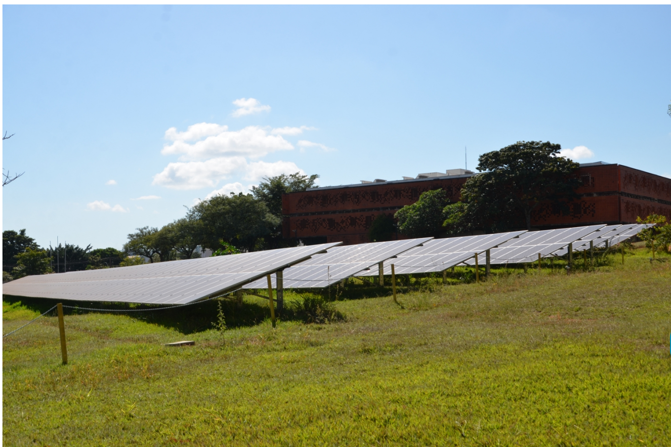
Usina de energia solar no Campus Santa Mônica da UFU.

Além disso, no que se refere ao ODS 13, ação climática, a UFU se destaca pelas ações de sustentabilidade nos campi, como a troca das lâmpadas pelo Programa de Eficiência Energética da Cemig, a instalação de painéis solares, além do monitoramento do clima em Uberlândia pelo Laboratório de Climatologia e Recursos Hídricos (LCRH).