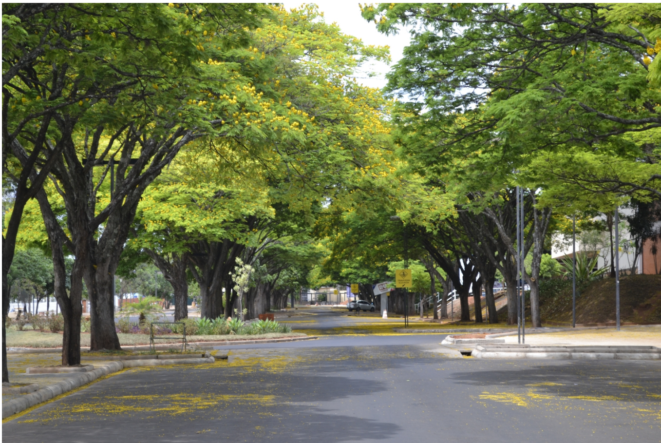
Rua arborizada do Campus Santa Mônica da UFU.