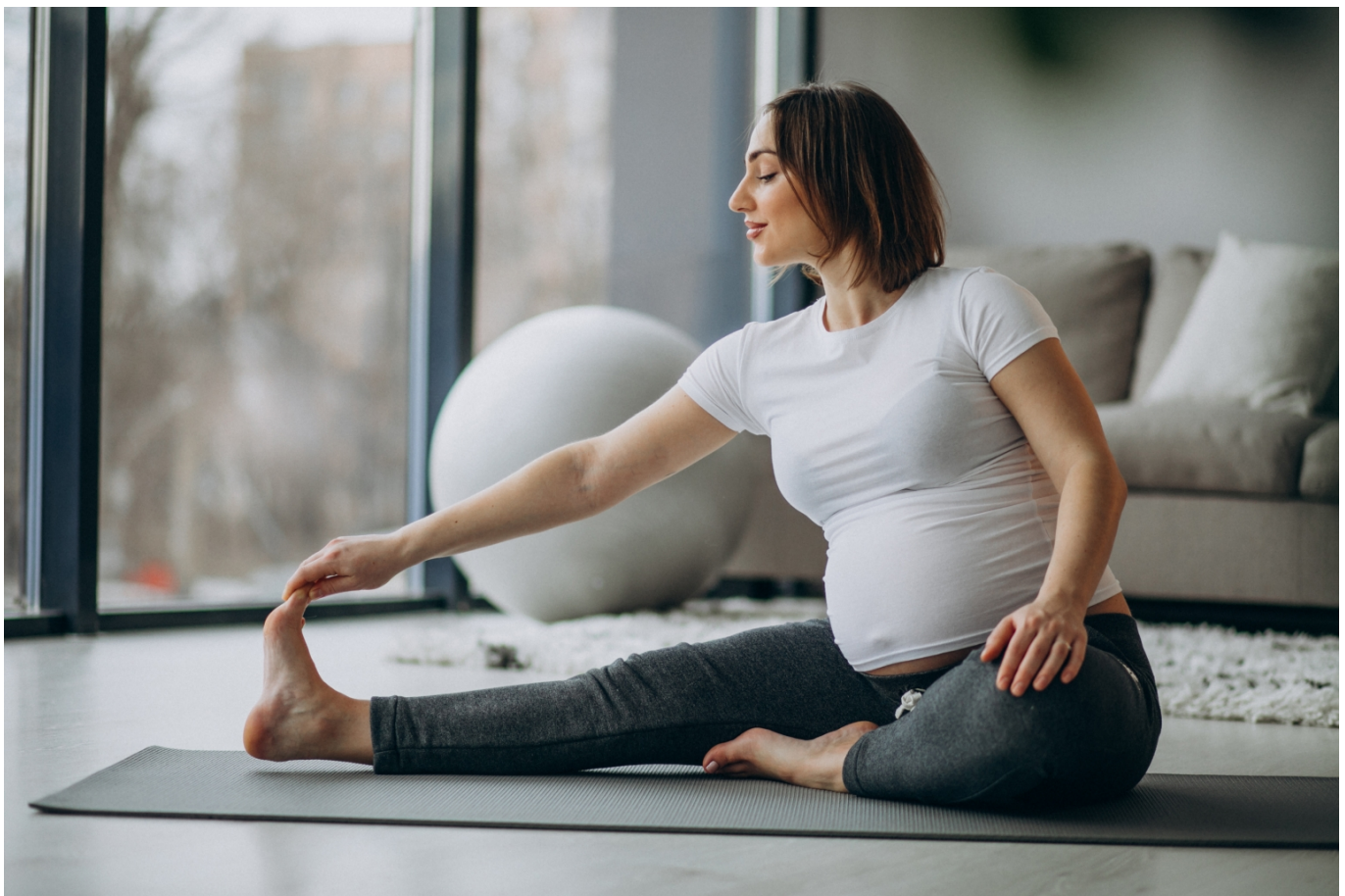
A diástase ocorre em 60% a 100% das mulheres durante a gestação

A Universidade Federal de Uberlândia (UFU) convida a comunidade a participar da nova chamada do projeto de Exercícios Físicos para gestantes. Para fazer parte do projeto, é necessário que a mulher seja maior de 18 anos, esteja na sua primeira gestação e entre 18 e 21 semanas gestacionais. Outro pré-requisito é que não tenha realizado cirurgia abdominal ao longo da vida.