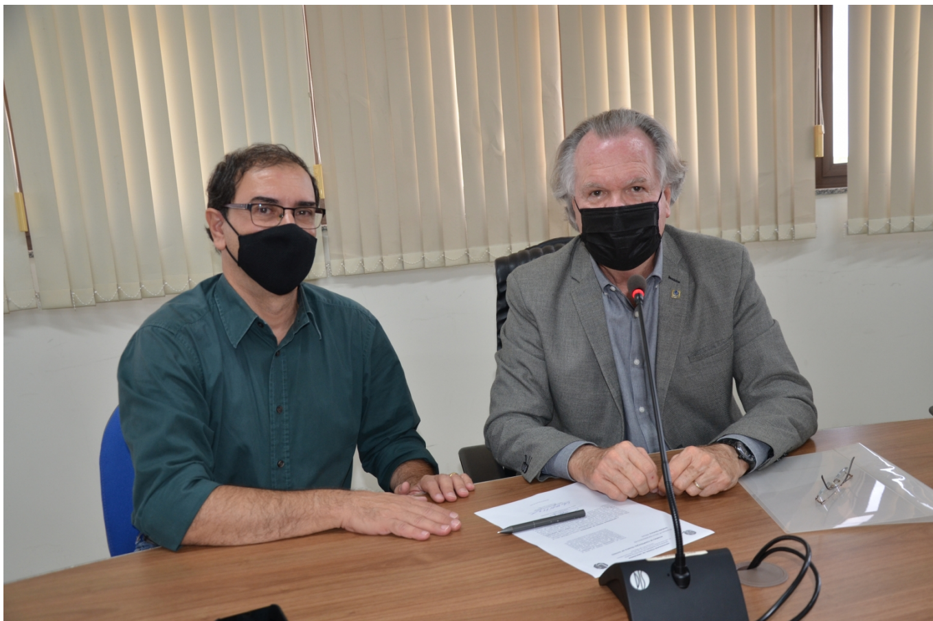
Parceria entre UFU e Praia Clube é inédita para o esporte universitário.

Na tarde da última segunda-feira, 27 de junho, a Universidade Federal de Uberlândia (UFU) e o Praia Clube assinaram um Termo de Acordo de Cooperação Técnica. A ação inédita entre as duas instituições objetiva impulsionar o esporte de alto rendimento entre os estudantes da UFU. A parceria abrange, inicialmente, cinco modalidades coletivas: basquetebol, handebol, futebol de campo, futsal e vôlei.