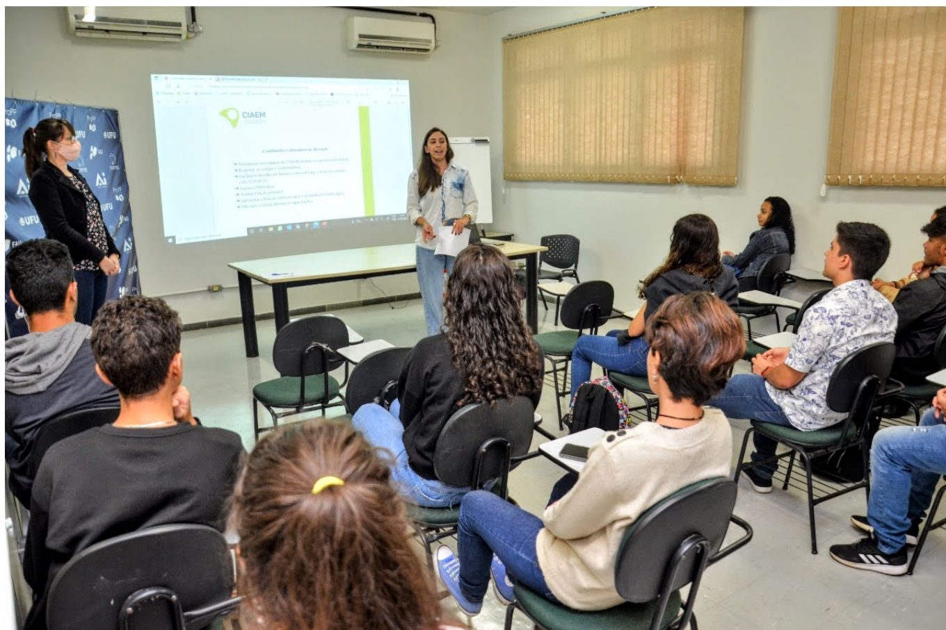
As atividades começaram em uma sala de treinamento com a participação de 15 alunos do Ensino Médio da Escola Estadual Frei Egídio Parisi, de Uberlândia.

O Centro de Incubação de Atividades Empreendedoras da Universidade Federal de Uberlândia (Ciaem/UFU) inaugurou, na quinta-feira (22/09), o Laboratório de Inovação. O espaço é mais uma ferramenta para o Ciaem promover a cultura empreendedora no município de Uberlândia e região.