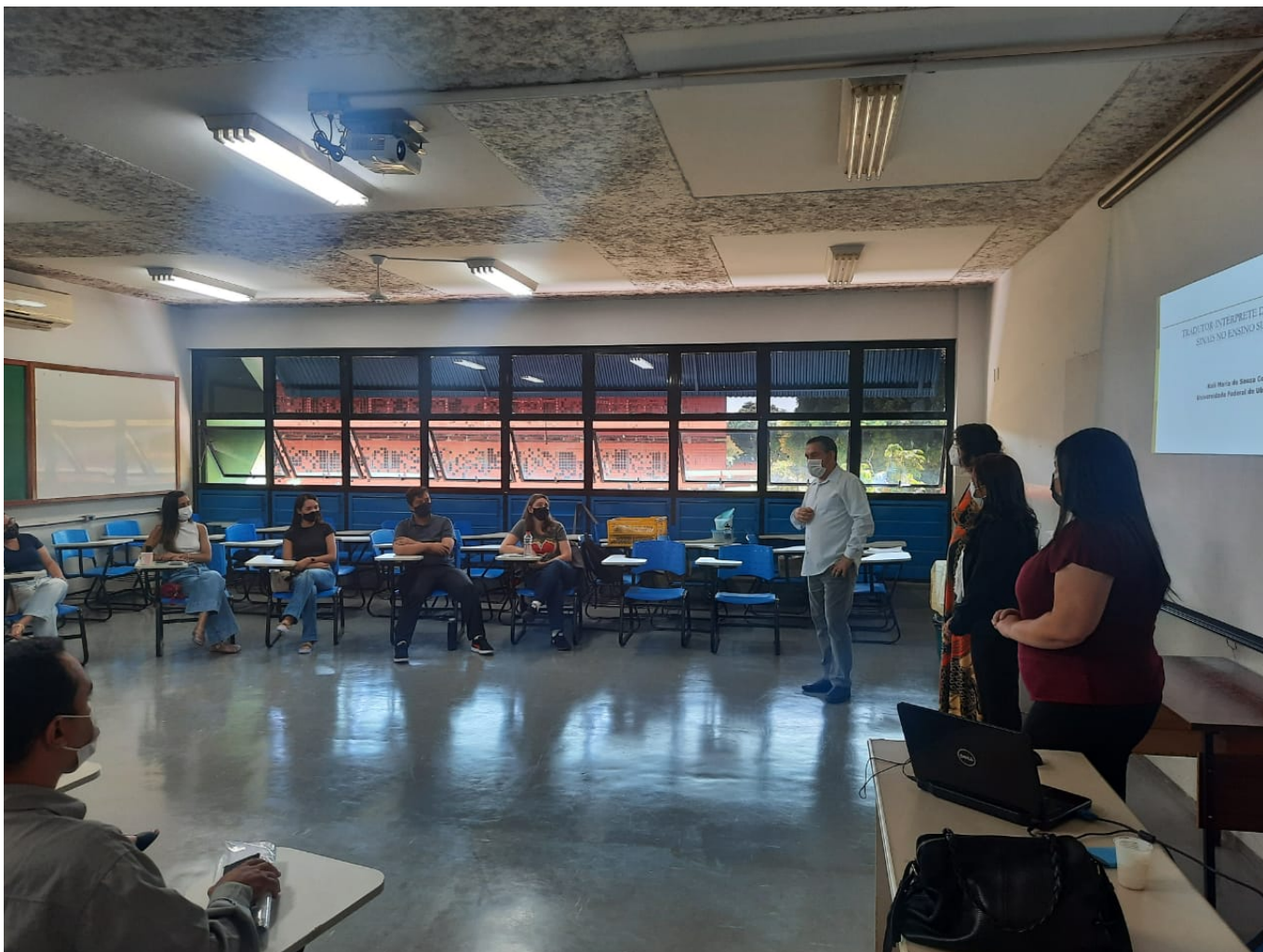
Abertura do evento de formação e integração de intérpretes e tradutores de Libras.