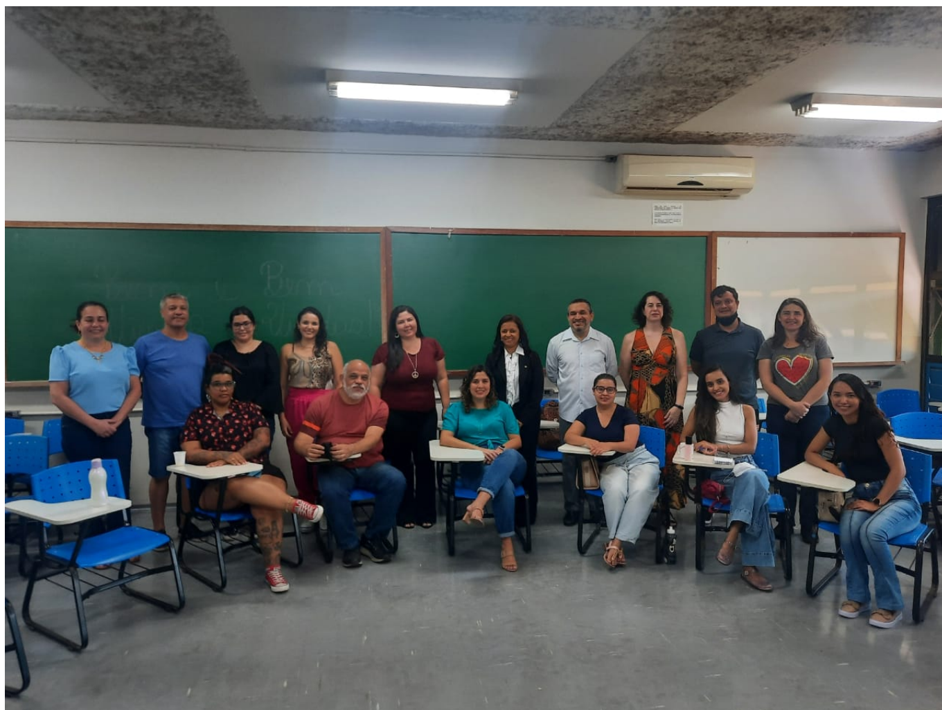
Intérpretes e Tradutores terceirizados participam de evento de integração.